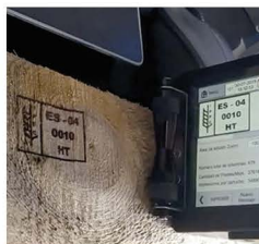
Muebles y madera