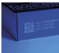
Tintas seguridad UV