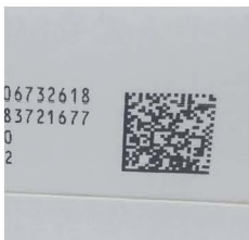
Códigos QR dinámicos